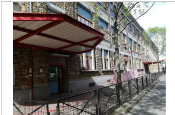
Projet de site - Auteur: Artelia