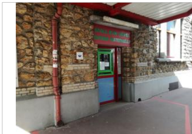
Projet de repère 1910 - Auteur : Artelia