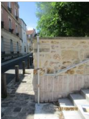
Projet de repère 1924 - Auteur: Artelia

Altitude calculée de l'eau (en m) : 34.64