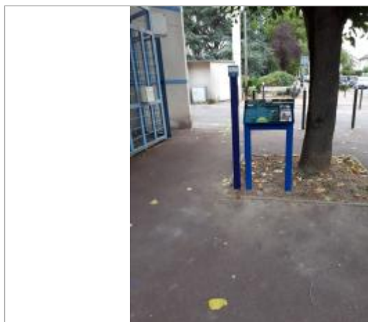
Projet de repère 1910 - Auteur : Artelia