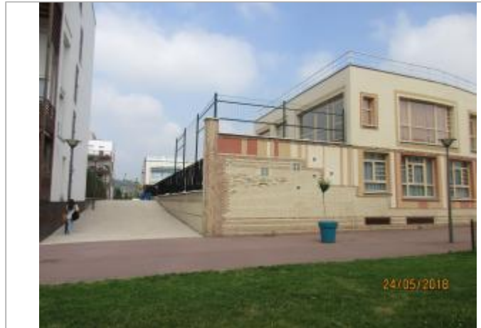
Projet de site - Auteur: Artelia

Coordonnées WGS84 : X: 2.38584280 / Y: 48.69114820