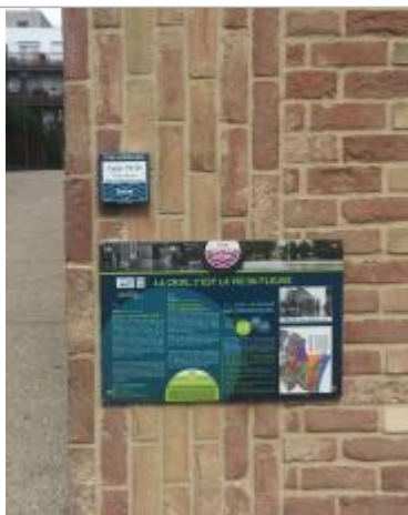
Projet de repère 1910 - Auteur: Artelia

Altitude calculée de l'eau (en m) : 36.23