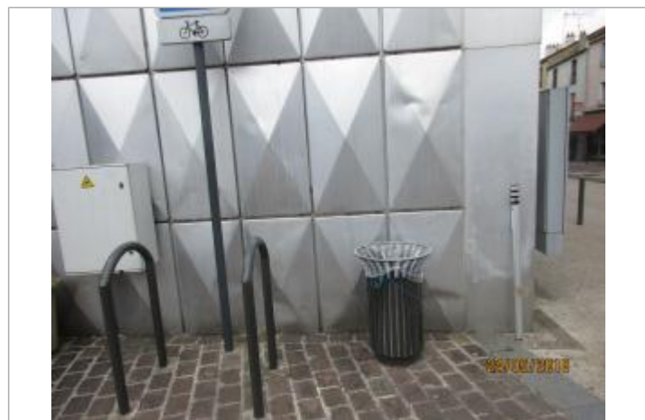
Projet de repère 1910 - Auteur : Artelia