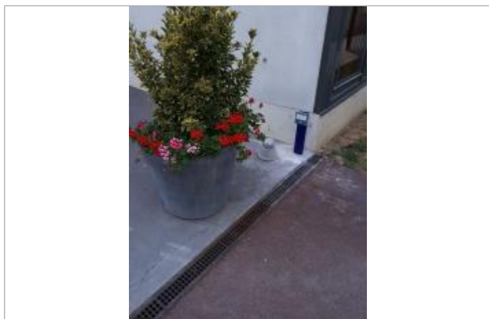
Projet de repère 1910 - Auteur : Artelia