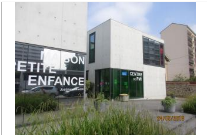
Projet de site - Auteur: Artelia