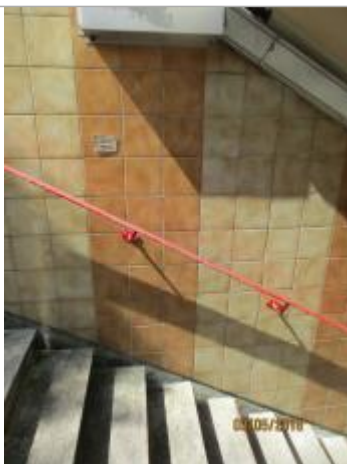
Projet de repère 1910 - Auteur : Artelia

Altitude calculée de l'eau (en m) : 36.73 m