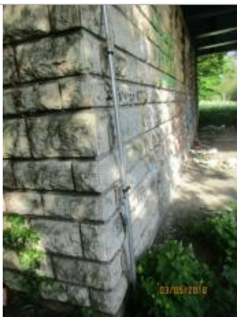
Projet de repère 1910 - Auteur: Artelia

Altitude calculée de l'eau (en m) : 36.53