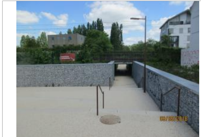
Projet de site - Auteur: Artelia