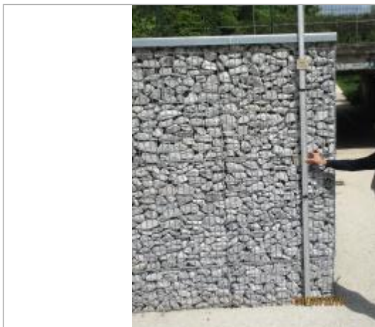
Projet de repère 1910 - Auteur : Artelia