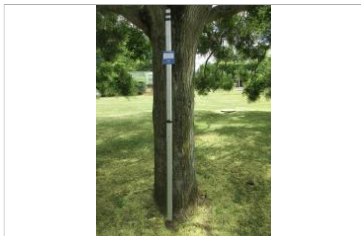
Projet de repère de crue reconstitué 1910 - Auteur : Artelia