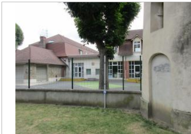
Projet de site - Auteur: Artelia