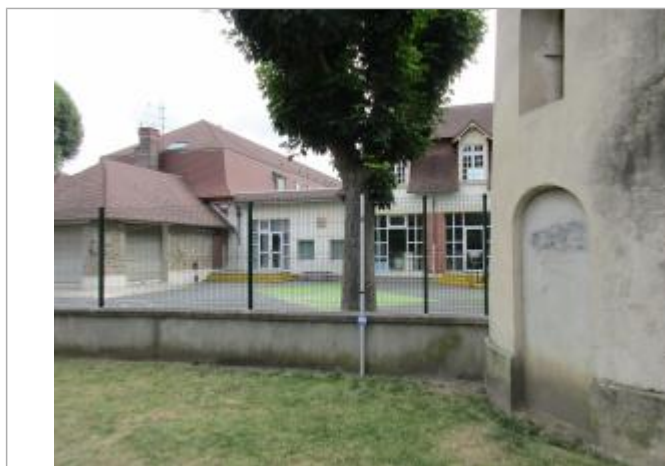
Projet de repère de crue reconstitué 1910 - Auteur: Artelia