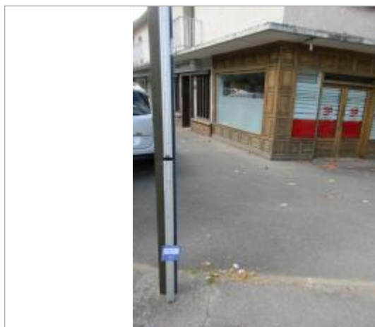
Projet de repère de crue reconstitué 1910 - Auteur : Artelia

Code : ARTELIA21_R_0156_1 Date de mise à jour : 26/10/2021 Auteur :