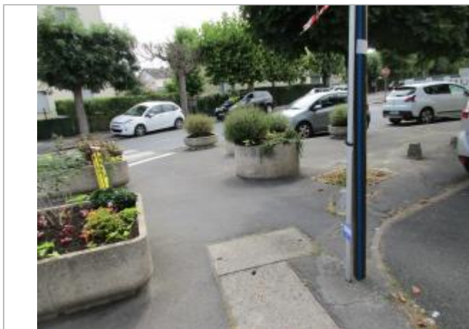
Projet de site - Auteur: Artelia