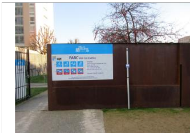
Projet de repère de crue reconstitué 1910 - Auteur : Artelia