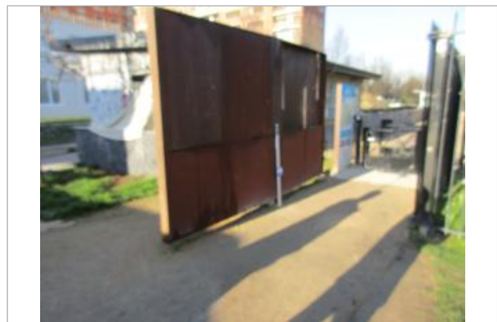
Projet de repère de crue reconstitué 1910 - Auteur : Artelia

GÉNÉRAL Code : ARTELIA21_R_0149_1 Date de mise à jour : 26/10/2021 Auteur :