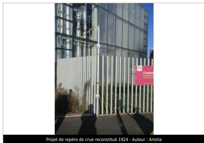
Projet de repère de crue reconstitué 1924 - Auteur : Artelia