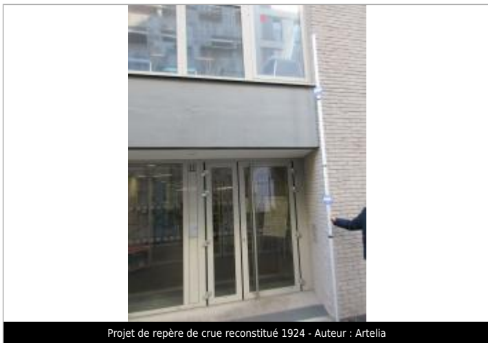
Projet de repère de crue reconstitué 1924 - Auteur: Artelia

Altitude calculée de l'eau (en m) : 33.55 m