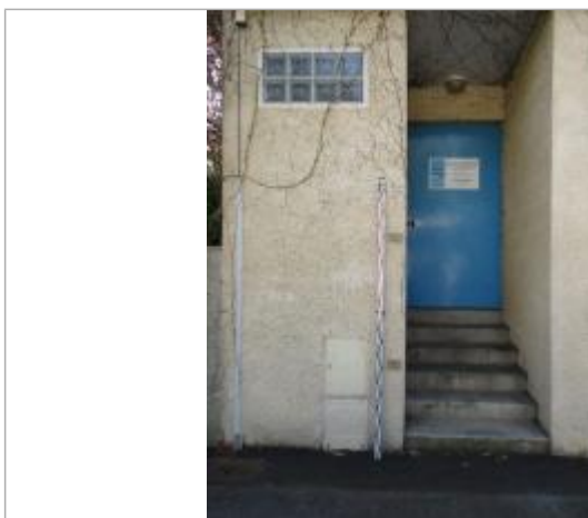
Projet de repère 1910 - Auteur: Artelia