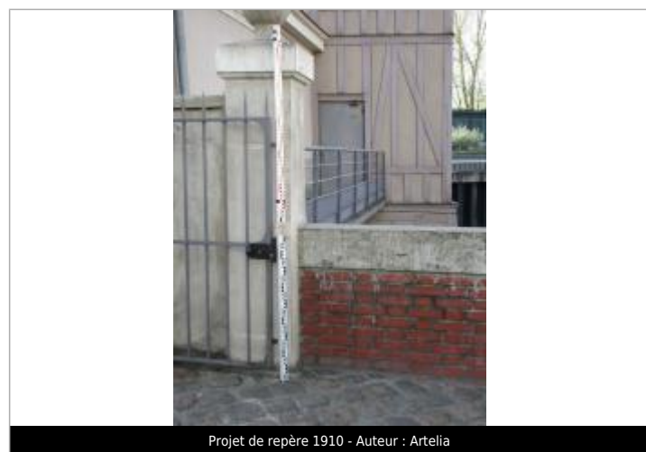
Projet de repère 1910 - Auteur : Artelia