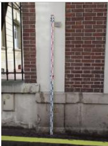
Projet de repère 1910 - Auteur: Artelia

Altitude calculée de l'eau (en m) : 35.32 m