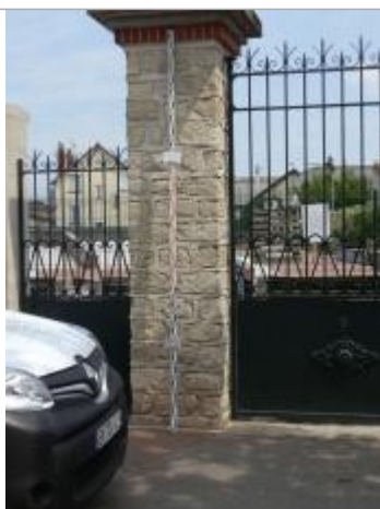
Projet de repère 1924 - Auteur : Artelia