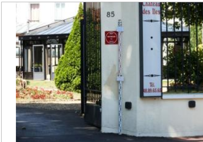
Projet de repère 1924 - Auteur : Artelia