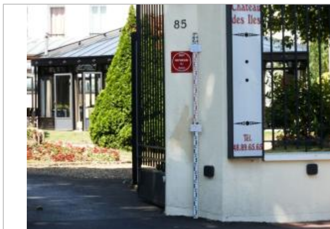
Projet de repère 1910 - Auteur : Artelia

Code : ARTELIA21_R_0114_1 Date de mise à jour : 05/07/2022 Auteur :