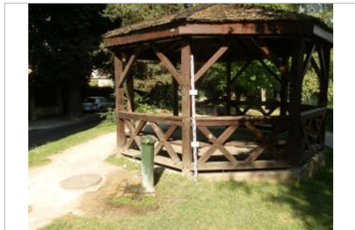
Projet de repère 1924 - Auteur : Artelia