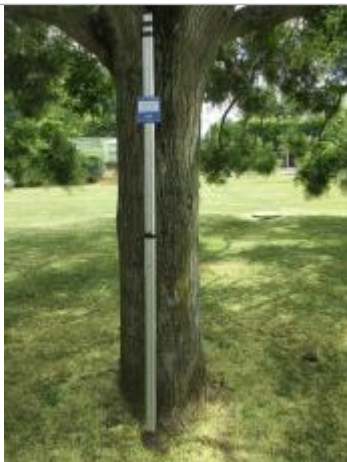
Projet de repère de crue reconstitué 1910 - Auteur : Artelia