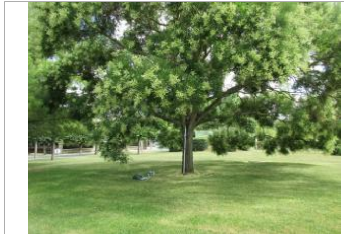
Projet de site - Auteur: Artelia