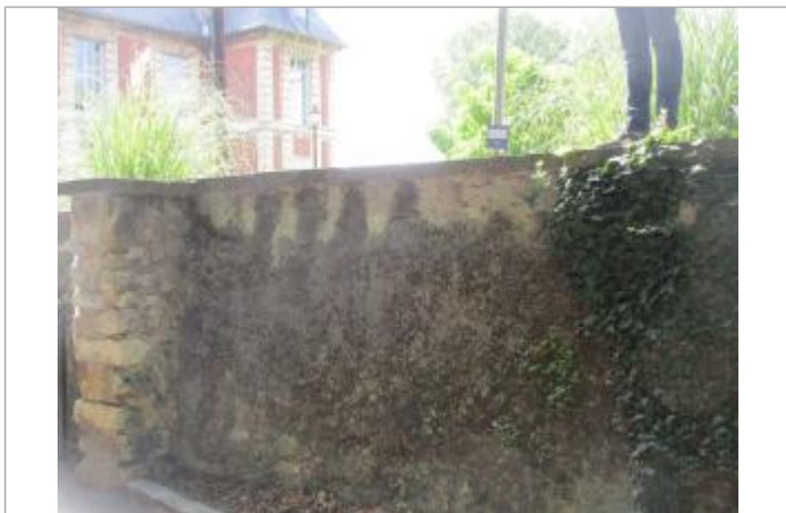
Projet de repère de crue reconstitué 1910 - Auteur : Artelia