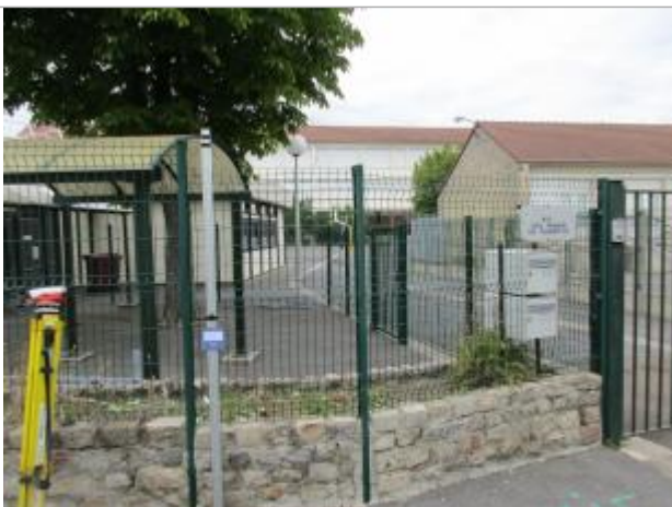
Projet de repère de crue reconstitué 1910 - Auteur : Artelia

Altitude calculée de l'eau (en m) : 40.38