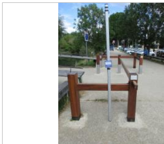
Projet de repère de crue reconstitué 1910 - Auteur : Artelia

Code : ARTELIA21_R_0155_1 Date de mise à jour : 26/10/2021 Auteur :