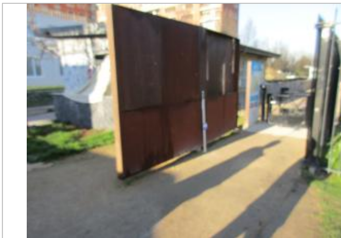
Projet de repère de crue reconstitué 1910 - Auteur: Artelia