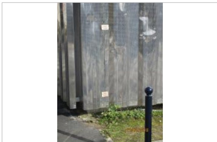
Projet de repère 1924 - Auteur: Artelia