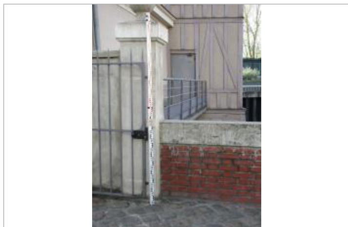
Projet de repère 1910 - Auteur: Artelia