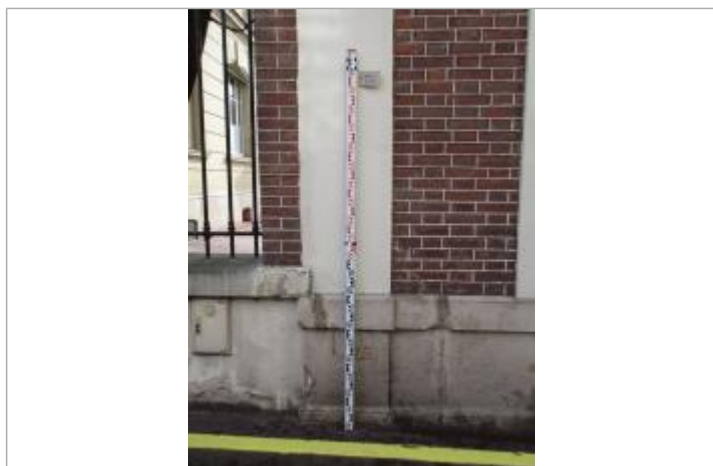
Projet de repère 1924 - Auteur : Artelia