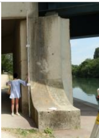
Projet de repère 1924 - Auteur: Artelia