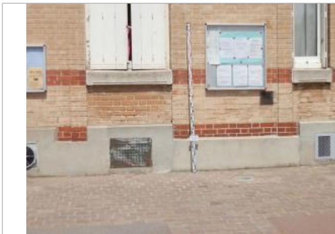
Projet de repère 1910 - Auteur: Artelia

Altitude calculée de l'eau (en m) : 36.39