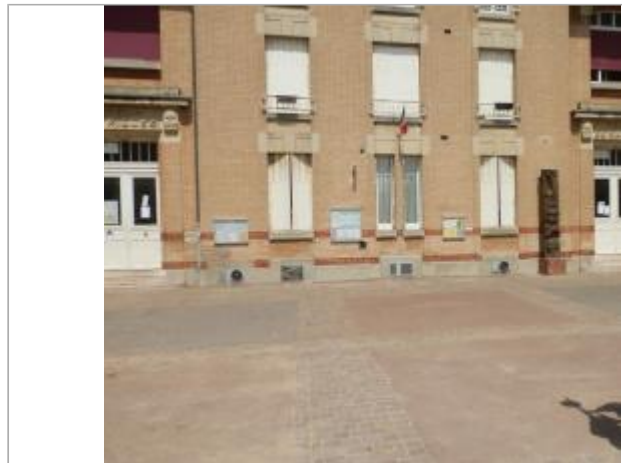
Projet de site - Auteur: Artelia

Coordonnées WGS84 : X: 2.50487480 / Y: 48.78963500