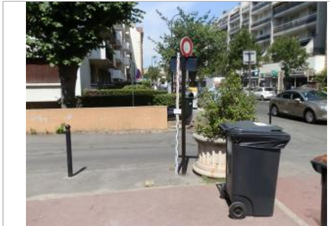
Projet de site - Auteur: Artelia

Coordonnées WGS84 : X: 2.51884800 / Y: 48.79166300