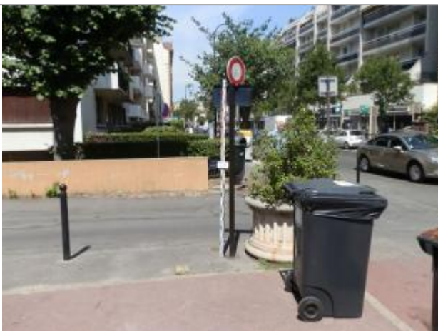
Projet de repère 1910 - Auteur: Artelia

Altitude calculée de l'eau (en m) : 36.63