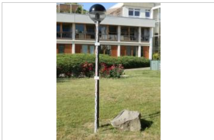
Projet de repère 1924 - Auteur: Artelia