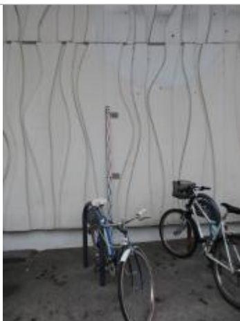
Projet de repère 1924 - Auteur: Artelia