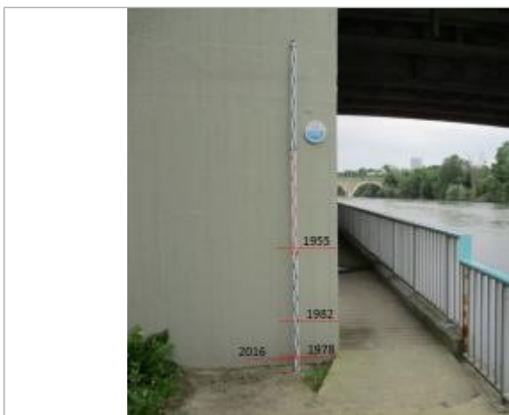
Projet de repère 1978 - Auteur: Artelia