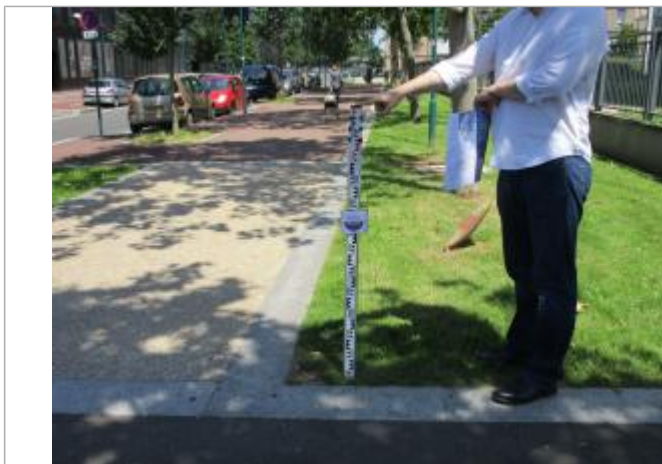
Projet de repère 1910 - Auteur : Artelia