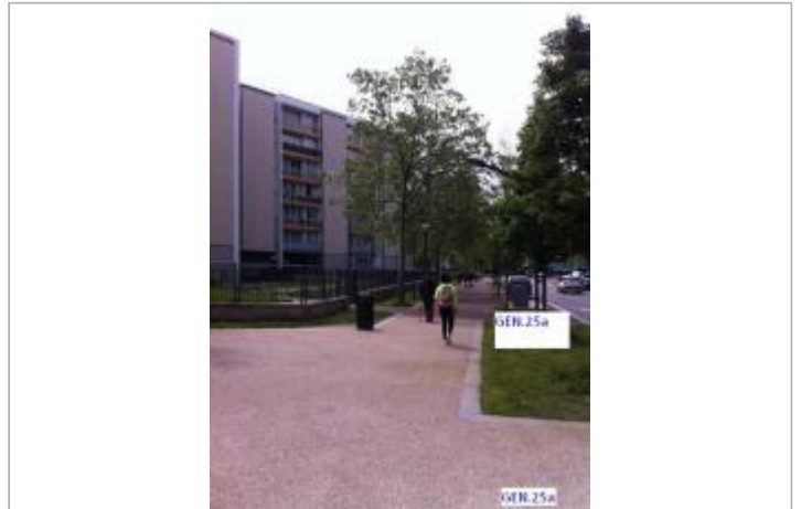
Projet de site - Auteur: Artelia