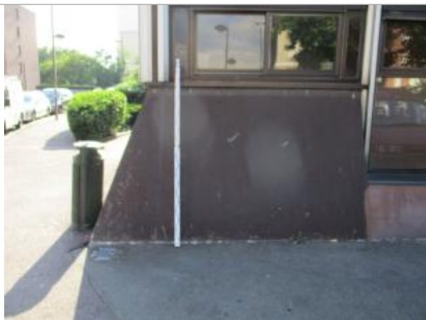
Projet de repère 1910 - Auteur : Artelia