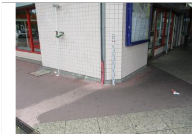
Projet de repère 1910 - Auteur : Artelia