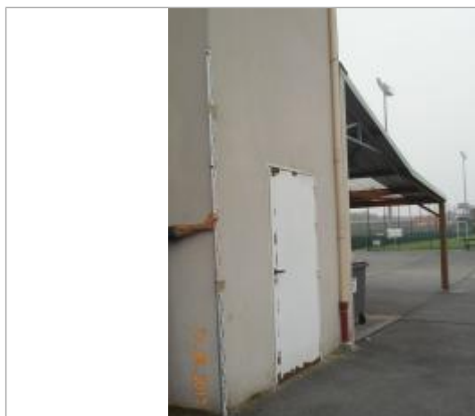
Projet de repère 1924 - Auteur: Artelia