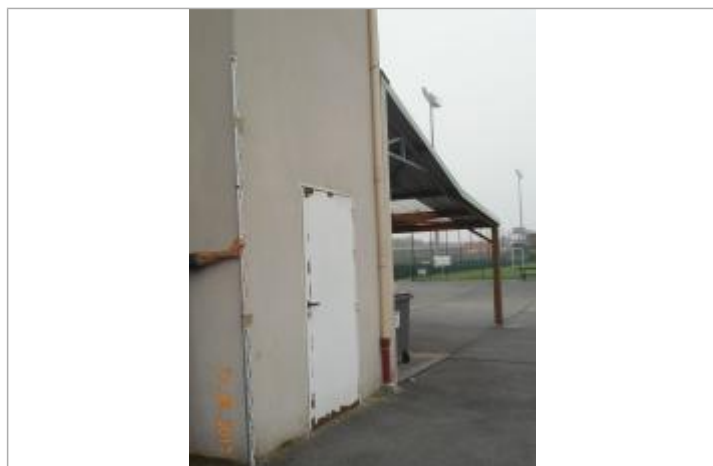
Projet de repère 1910 - Auteur : Artelia