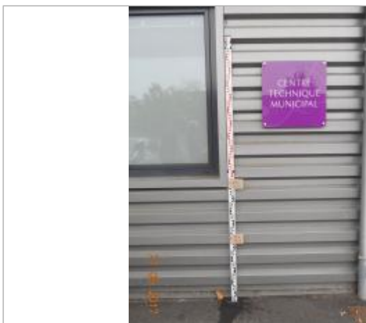
Projet de repère 1910 - Auteur : Artelia