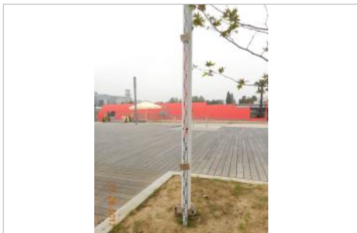
Projet de repère 1924 - Auteur: Artelia