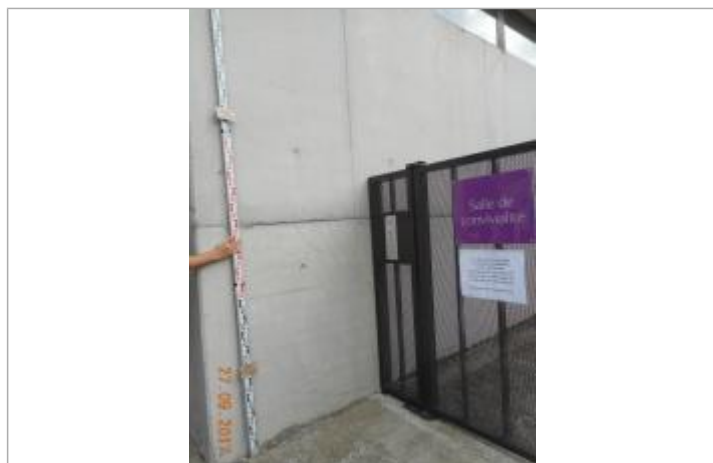
Projet de repère 1924 - Auteur: Artelia