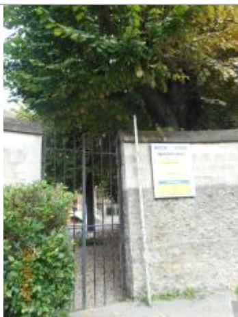
Projet de repère 1924 - Auteur : Artelia