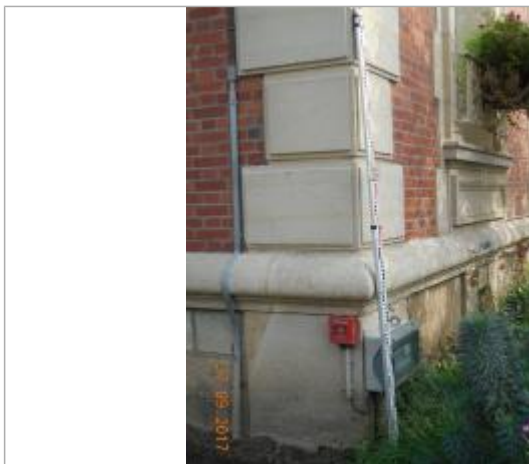
Projet de repère 1910 - Auteur : Artelia