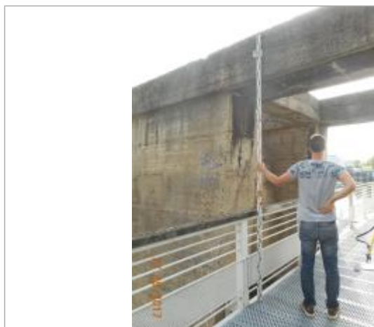
Projet de repère 1910 - Auteur: Artelia