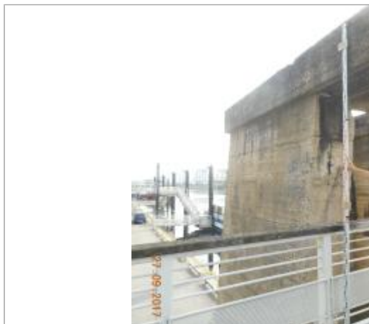
Projet de site - Auteur: Artelia

Coordonnées WGS84 : X: 2.41013380 / Y: 48.80629440