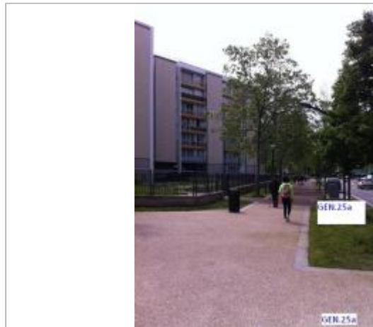
Projet de site - Auteur: Artelia

Coordonnées WGS84 : X: 2.29582600 / Y: 48.91732250