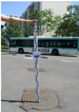
Projet de repère 1910 - Auteur: Artelia

Altitude calculée de l'eau (en m) : 29.35