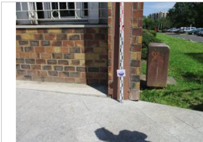
Projet de repère 1910 - Auteur: Artelia

Altitude calculée de l'eau (en m) : 29.3