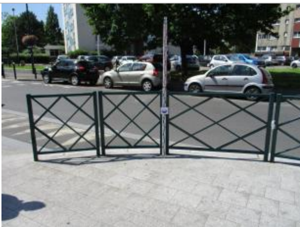
Projet de repère 1910 - Auteur : Artelia